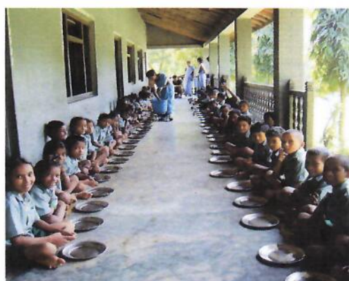
Swissair Tiger Tops Pre-School

Merci Swissair pour l'Aide à l'Enfance !