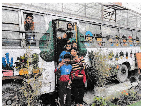
Orphelinat NAG à Katmandu, Népal Merci à la Fondation Swissair pour l'Aide à l'Enfance !