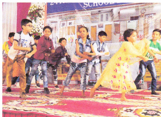
Inauguration festive de S.V.M. «Ecole de Bidonville» à New Delhi