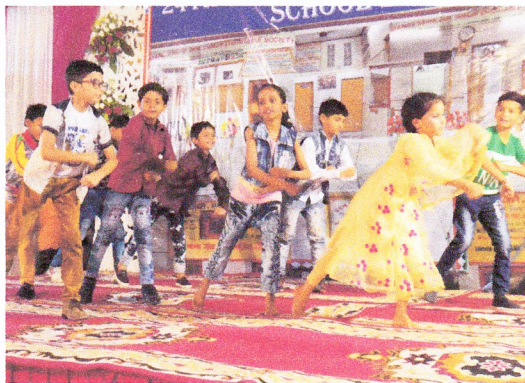
Eröffnungsfeier: S.V.M. «Slum Schule» in New Delhi